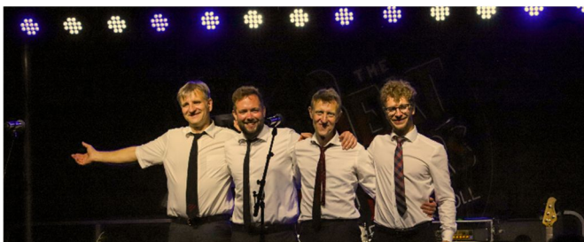
THE BEAT BROTHERS • SO 03.09.2023 • SCHLOSSGARTENFEST • DIEBURG

Der „Festival-Könner“ Showmaker hat eine neue Veranstaltung ins Leben gerufen: Das FesDival im Dieburger Schlossgarten. Den krönenden Abschluss am Sonntagabend, 3. September bildet das Konzert der Beat Brothers ab 20:00 Uhr.